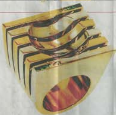
这款男戒指,以大自然为设计灵感,绿色宝石和黄金相间。

他举例,英国一些首饰店设有这类珠宝设计软件,顾客可直接与设计师讨论,从珠宝、金属的选择到钻石的大小,顾客可根据个人喜好选择。之后,设计师可将设计交给工匠去打造首饰,没一会儿功夫就可完成定制首饰。