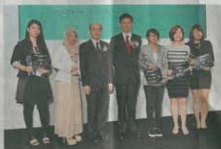
新加坡珠宝设计奖得奖者与颁奖嘉宾合影,青年及体育学院院长李善勇、通讯及艺术部政务部长陈伟南(左四),及安昌珠宝董事陈耀辉(左三)合照。